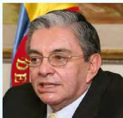
Fabio Valencia Cossio

política pública para la rama judicial. El poder ejecutivo está cumpliendo con su mandato de ayudar al judicial y de darle independencia, no elige magistrados, el papel del gobierno es nombrar candidatos. El Gobierno Nacional provee los recursos y garantiza que las decisiones del judicial se respeten. La Rama Judicial debe ser eficiente, como decía Echandía: "Una justicia lenta no es justicia." Frente a la pregunta sobre si el Ministerio de Justicia e Interior es más eficiente separado o junto, se afirmó que hay dos posturas diferentes y el gobierno está dispuesto a promover una comisión que estudie todas las posibilidades. Es importante reconocer que la crisis actual de la justicia no está ligada a la independencia de los poderes. Recojamos las banderas de la sensatez y la cordura, los esfuerzos de nuestros ciudadanos no deben quedar en vano.