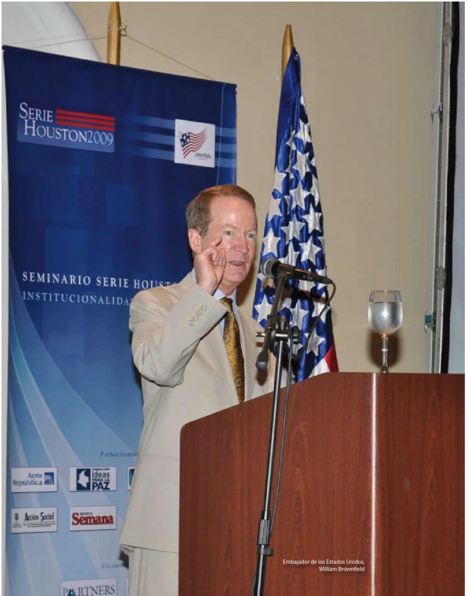
Embajador de los Estados Unidos, William Brownfield