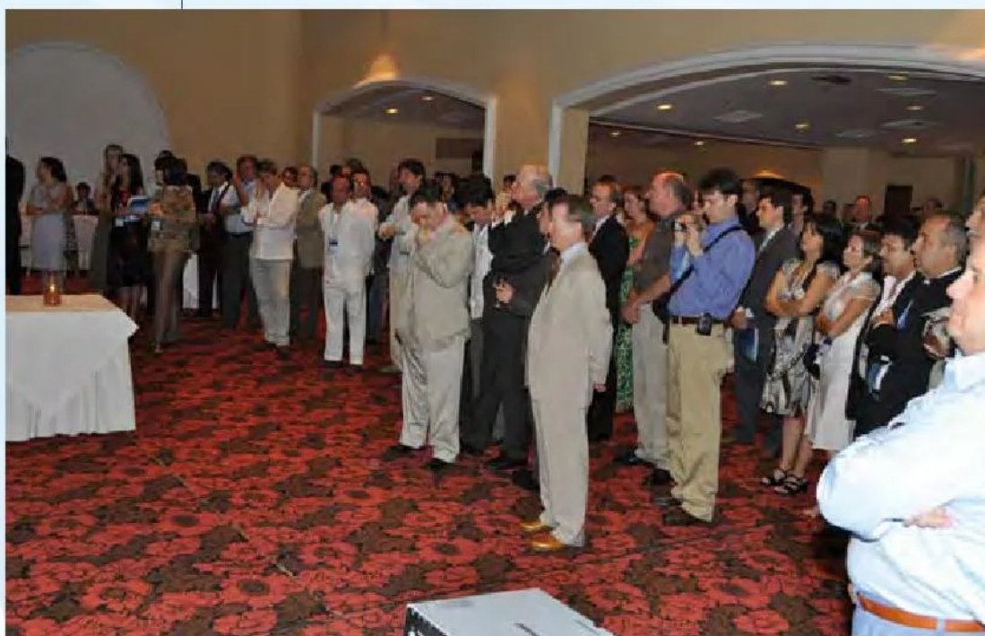
Coctel de Bienvenida Seminario Serie Houston 2009.

El fruto de este esfuerzo común entre Partners Colombia y Fundación Ideas para la Paz es lo que presentamos a continuación. Esperamos que lo disfrute.