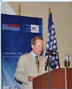
Embajador de los Estados Unidos, William Brownfield

A continuación se presenta un resumen de las principales ideas que cada panelista expuso durante el seminario. Para leer cada ponencia completa, por favor remítase al DVD que acompaña a este libro.