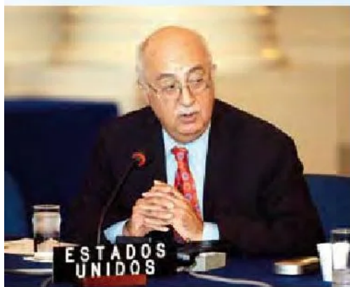
Ex Embajador de Estados Unidos ante la OEA, John Maisto.

Algunas de las amenazas más claras a la gobernabilidad democrática son: la inseguridad personal y el crimen, la falta de un estado de derecho